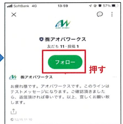
⑤アオワークスをフォローする